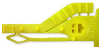
GRIP SEGUR 'POST'